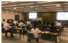
食品商談会基礎講座 もしくは販路開拓セミナー