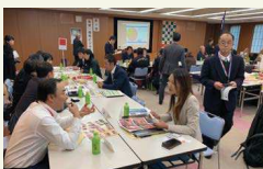
佐賀福岡ビジネス交流会