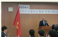
ベトナム進出企業様情報交換会