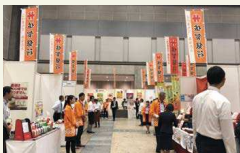
地方銀行共催「フードセレクション」 3年連続参加地銀最多の出店をいただきました!