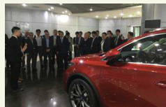
深圳・広州商談視察ミッション