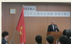
ベトナム進出企業様情報交換会