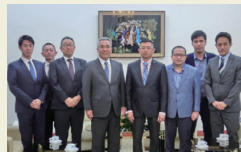
ベトナム視察ミッション