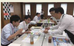
佐賀福岡ビジネス交流会