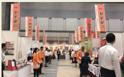
地方銀行共催「フードセレクション」