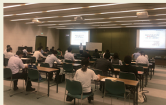
食品商談会基礎講座 もしくは販路開拓セミナー