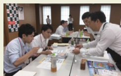
佐賀福岡ビジネス交流会