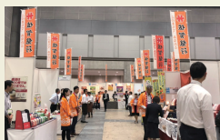
地方銀行共催「フードセレクション」