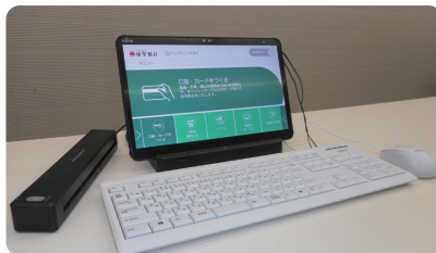
ペーパーレス、オペレーションレス、検証レスが実現し、シームレスな事務手続きが実現! (※一部の取引を除く)