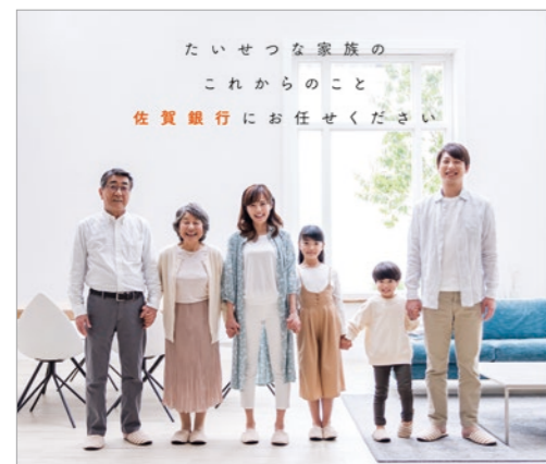
資産承継・相続のご案内