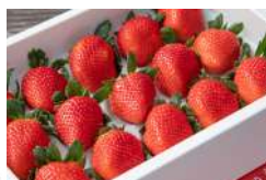
香月農園さんのさがほのか