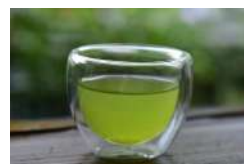
旨味を実感 嬉野茶セット