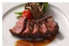
佐賀牛 レンジ de ステーキ