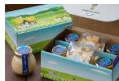
フライングカウの牧場プリン