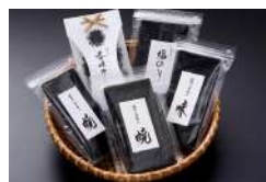
有明海の恵み 海苔詰め合わせ