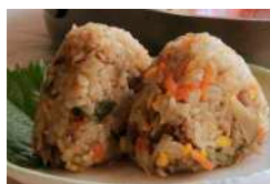
みつせ鶏を頬張る 佐賀米おにぎりセット