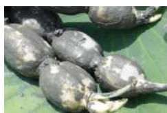
泥付き白石れんこん