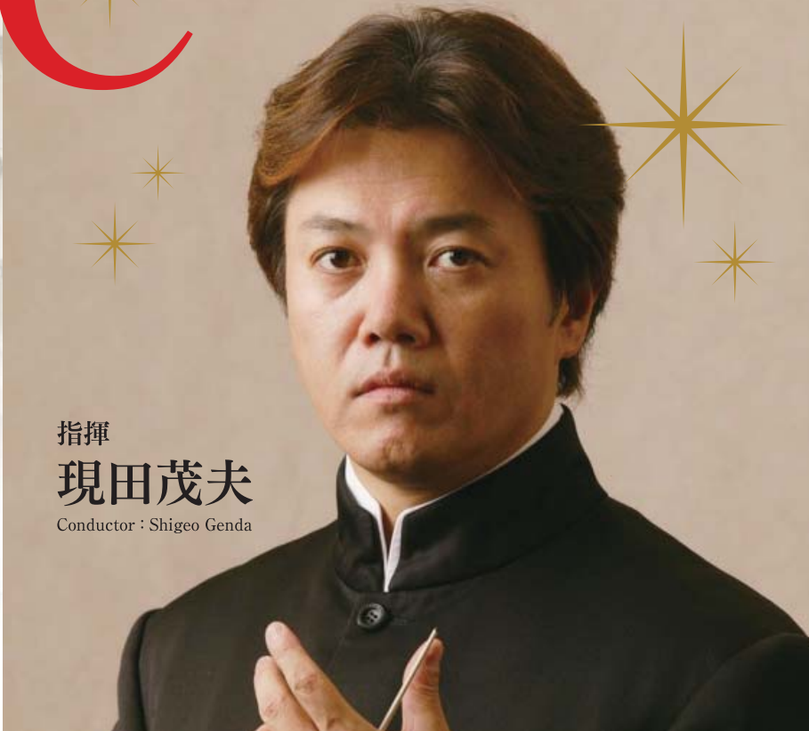
指揮 現田茂夫 Conductor : Shigeo Genda