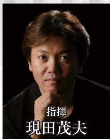
指揮 現田茂夫 Conductor : Shigeo Genda

バラエティに富んだ活動でオーケストラからの信頼も厚いマエストロ。東京音楽大学作曲指揮専攻(指揮)で汐澤安彦、三石精一両氏に師事。その後東京藝術大学で佐藤功太郎、遠藤雅古両氏に師事。1985年安宅賞受賞。96年より13年間神奈川フィルハーモニー管弦楽団を指導し飛躍的に躍進させ、その功績を称えられ2009年より名誉指揮者の称号を得る。他の主要オーケストラとも数多く共演し高評を得ている。