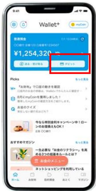
(バーチャルデビット申込画面)